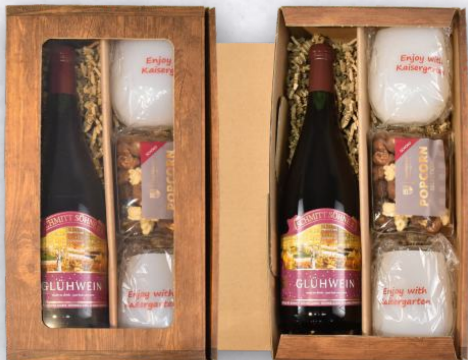
50006 Present Santa Claus 23

Present Santa Claus: Ist in unserer Holzdekor Faltschachtel ein perfektes Geschenk zum sofort genießen. Feinster, trinkfertiger Glühwein mit 2 wärmefesten Mehrweg Silikonbechern und zum Knabbern feines Popcorn in der Geschmacksrichtung Schokolade.