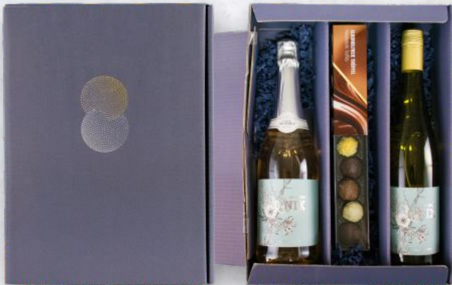
50058 Present Zero o, Nix

Present Zero o, Nix: Wir müssen nicht auf Genuss verzichten. Dieser Riesling von der Mosel und der feine Sekt aus Südfrankreich geben auch ohne Alkohol einen wunderbares Geschmackserlebnis. Auch die Trüffelpralinen sind vollkommen alkoholfrei. In einer schönen hochwertigen Geschenkbox verpackt. Eine Geschenkbox für alle, die auf Alkohol verzichten.